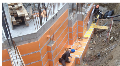
Installation latérale des nattes anti-vibratiles

En outre, mageba a fourni une assistance pour la mise en place d'une isolation phonique et d'une isolation contre les vibrations en termes de mesures d'assurance qualité.