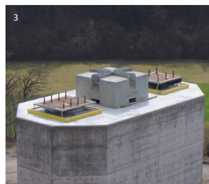
1 Aufbau TE Lager mit seitlichen Führungsleisten 2 Eingebautes TA Lager mit Bewegungsanzeige 3 Eingebaute TA und TF Lager mit Ankerplatten