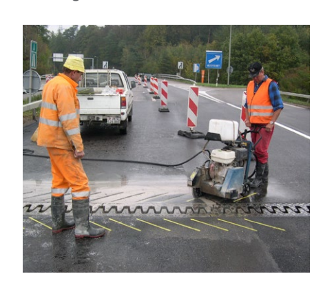
Schneiden der Schlitze in einem 45° Winkel zur Fahrtrichtung

Auf unserer Website mageba-group.com finden Sie weitere Produktinformationen sowie Referenzlisten und Ausschreibungsunterlagen.