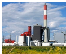
Kraftwerk Theiss (AT)