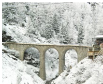
Val da Pila (CH)