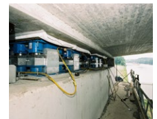
Maas Waalkanaal (NL)