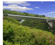
La Réunion (FR)