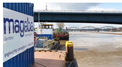
Ponton an seinem Liegeplatz

Mit den neuen mageba Kalottenlager ist die Mainbrücke Hochheim wieder deutlich besser für die künftigen Herausforderungen gerüstet.