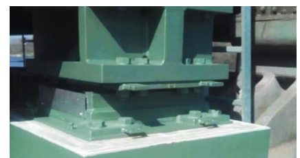
Ein RESTON®SPHERICAL Kalottenlager nach Abschluss der Installation

Stadt: Hochheim Land: Hessen / Deutschland Typ: Bogenbrücke Fertigstellung: 1904 Hauptspanne: 293 m Länge: 561 m Eigentümer: Preußisch-Hessische Eisenbahngemeinschaft Auftraggeber: DB Netz AG, Regionalbereich Mitte Architekt: Johann Caspar Harkort