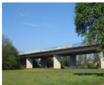
Ohrntalbrücke Öhringen (DE)