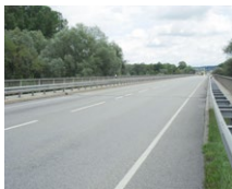
Innbrücke Simbach (DE)