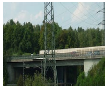
BAB A8 Wendlingen (DE)