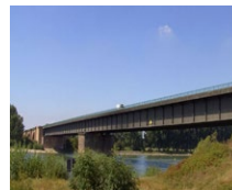
Rheinbrücke Frankenthal (DE)