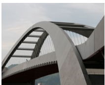
Gleisbogen Brücke (CH)