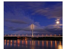
River Suir Brücke (IR)