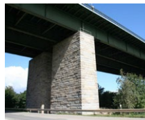
Danube Brücke Sinzing (DE)