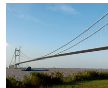
Run Yang Brücke (CN)