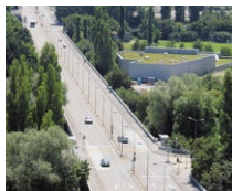
Europe Brücke (CH)