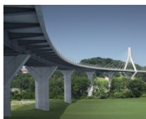
Ponte de la Poya (CH)