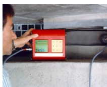
Apoios de levantamento e medição