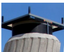
Apoios de deformação