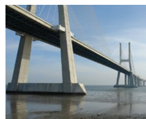
Ponte Vasco da Gama (PT)