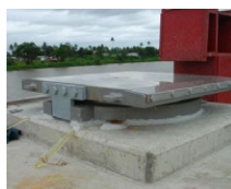
Apoios para Tabuleiros de lançamento Incremental