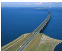
Ponte Storebaelt West (DK)