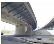
Ponte sur le Buron (CH)