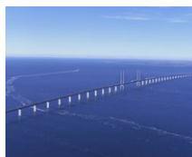
Ponte Øresund (DK/SE)