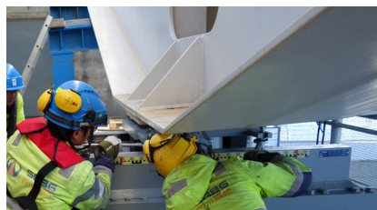
Установка сдвигового упора RESTON®FORCE

Два шок-трансммитера RESTON®STU, рассчитанные на максимальную нагрузку в 10'400 кН и перемещения +/-450 мм, весят 6 тонн каждый. Из-за ограниченного пространства шок-трансммитеры оборудованы двумя камерами с разным объемом масла.