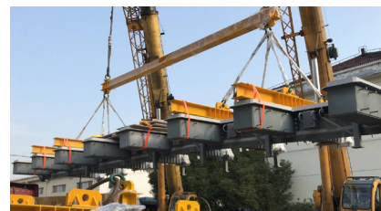
Доставка ДШ TENSA®MODULAR на объект

Город: Нарвик Страна: Норвегия Тип: Подвесной мост Пролёт: 1,145 м Длина: 1,533 м Построен: 2018 Владелец: Norwegian Public Roads Подрядчик: Sichuan Road and Bridge Group Инженер: COWI