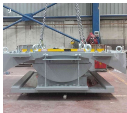
8 RESTON®CYLINDER UPLIFT ermöglicht die Übertragung von Zug- und Druckkräften 9 RESTON®CYLINDER PENDULUM wie für die dritte Bosphorus Brücke in der Türkei gebaut

Detaillierte Angaben finden Sie in der Installationsanleitung für Bauwerkslager.