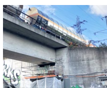
SBB Schänzli (CH)