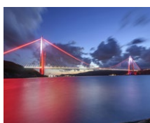
3 rd Bosphorus Brücke (TR)