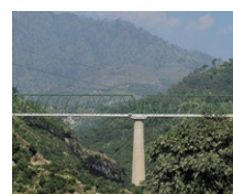
Brücke Nr. 20, USBRL (IN)