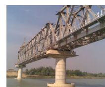
Bhagirathi Bahnbrücke (IN)