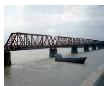
Bhairab Bahnbrücke (BD)